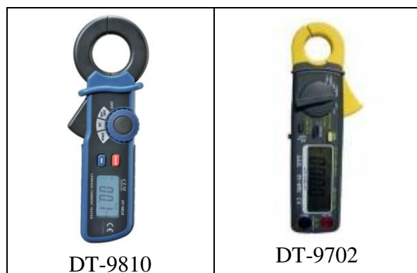
Рисунок 1. Фотографии общего вида клещей серии DT