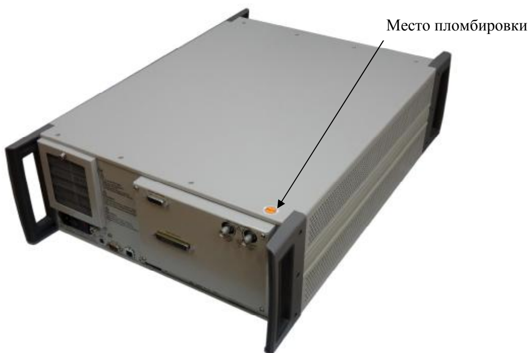
Рисунок 2 - Внешний вид калибратора