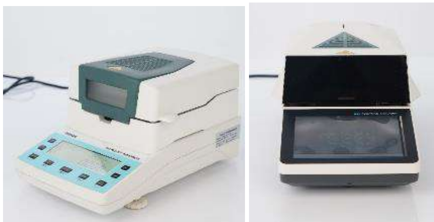
Рисунок 1 – Общий вид анализаторов

Общий вид анализаторов представлен на рис. 1.