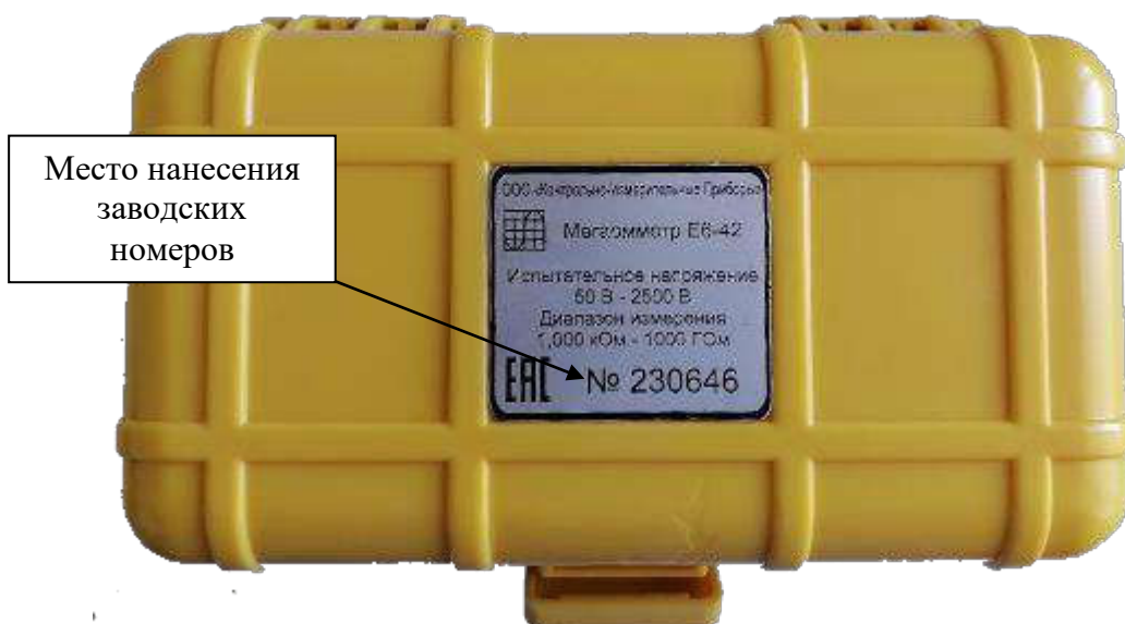
Рисунок 5 – Обозначение места нанесения заводских номеров на мегаомметры Е6-42