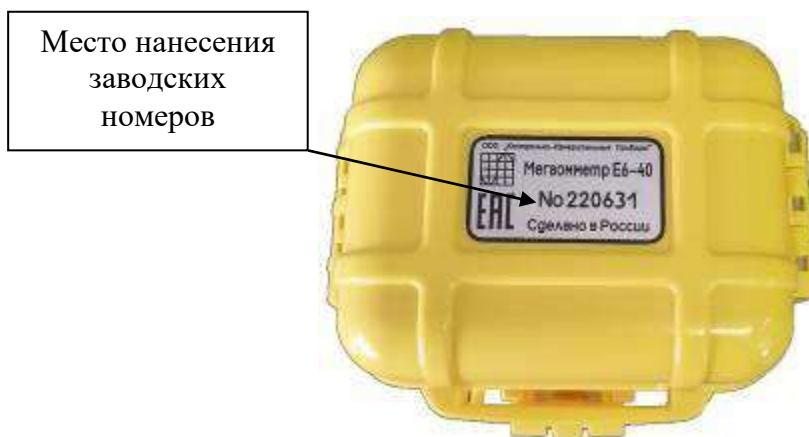
Рисунок 4 – Обозначение места нанесения заводских номеров на мегаомметры Е6-40, Е6-41