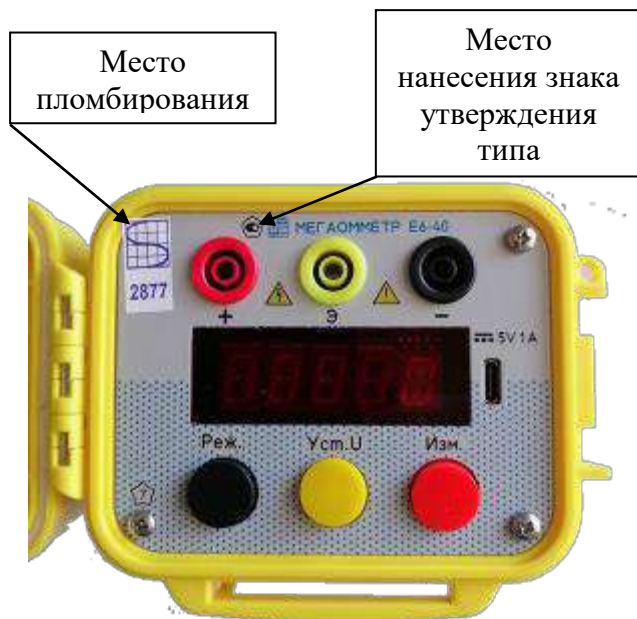
Рисунок 1 – Общий вид мегаомметров Е6-40