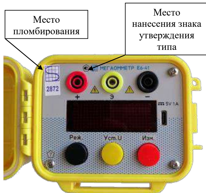
Рисунок 2 – Общий вид мегаомметров Е6-41