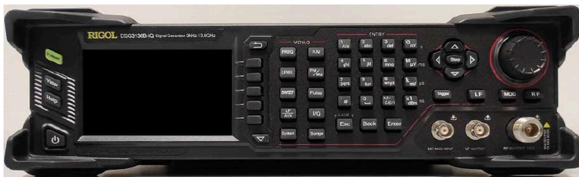
Рисунок 1 – Передняя панель генераторов DSG3000B