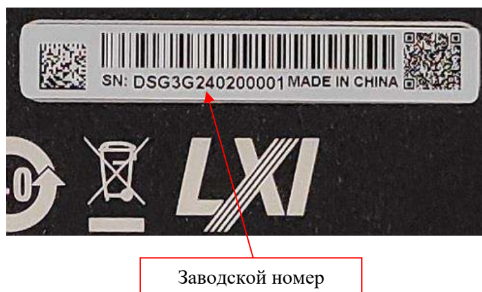
Рисунок 4 – Фрагмент задней панели генераторов DSG3000B с этикеткой