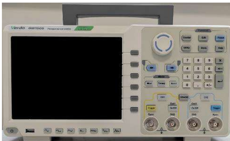
Рисунок 2 – Общий вид (передняя панель) генераторов GW1501 – GW1505