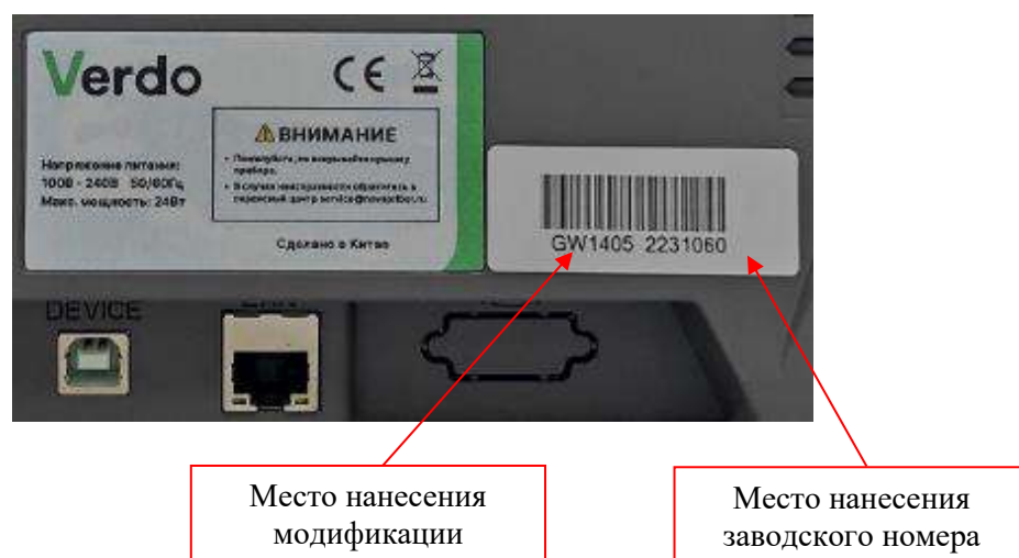
Рисунок 4 – Фрагмент задней панели генераторов с этикеткой