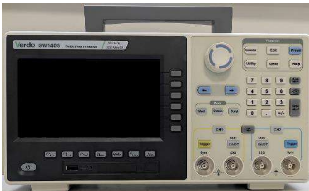
Рисунок 1 – Общий вид (передняя панель) генераторов GW1401 – GW1405

Места для нанесения знака утверждения типа и знака поверки, а также схема пломбирования указаны на рисунке 3.