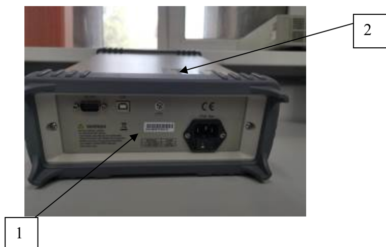
Рисунок 3 – место нанесения заводского номера (1); место нанесения знака поверки, знака ТР ТС (2) на примере задней панели модификации MB2102

Пломбировка мультиметров не предусмотрена.