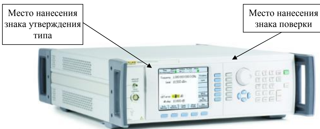
Рисунок 1 - Внешний вид источника модели 96040A

Внешний вид источников с указанием мест размещения знаков поверки и утверждения типа, а также мест пломбирования (наклеек) от несанкционированного доступа, приведены на рисунках 1-3.