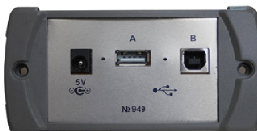
Рисунок 3 - Вид сбоку (электрические разъемы)