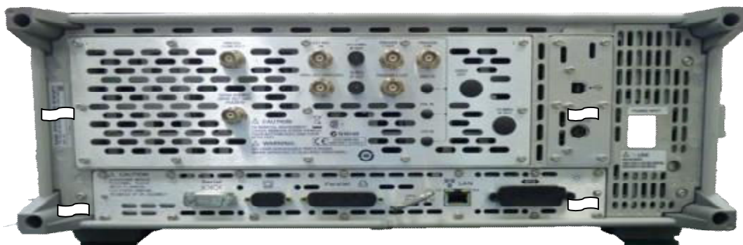
Рисунок 2 - Схема размещения наклеек от несанкционированного доступа