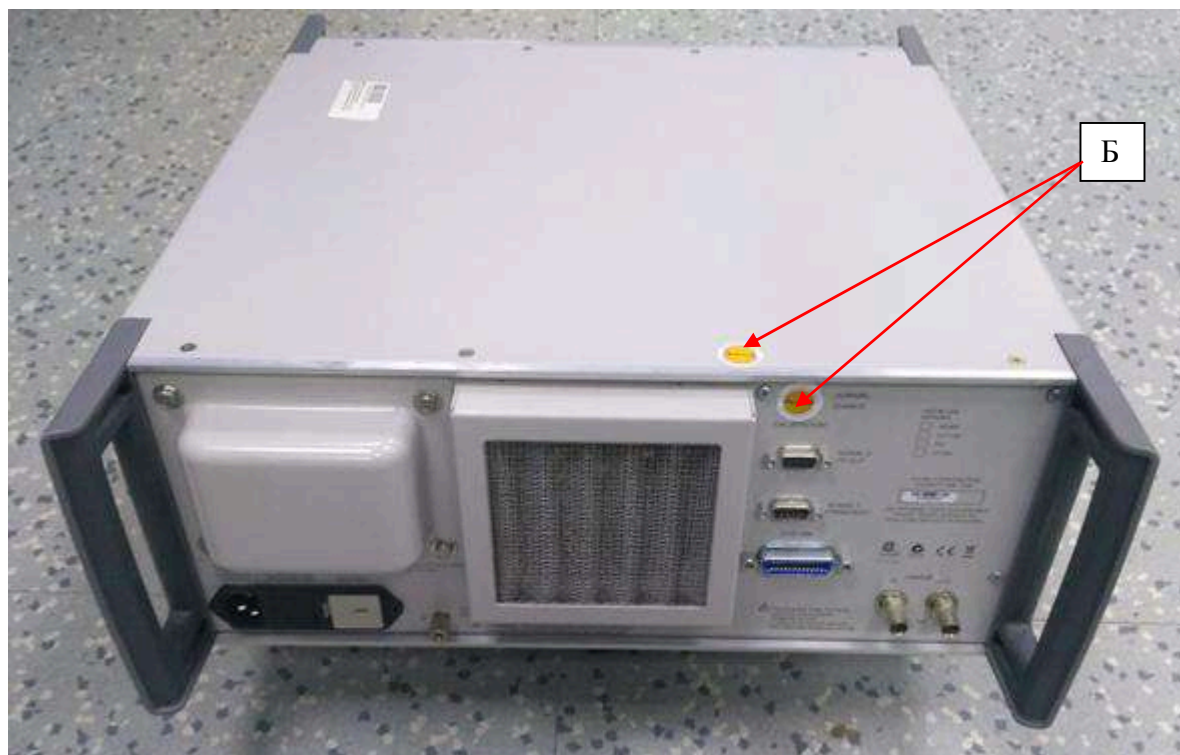
Рисунок 2 – Схема пломбировки от несанкционированного доступа (Б)