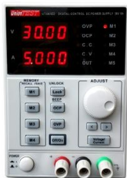
Рис. 1 Внешний вид источников UT3000-6000ED/EP