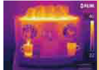
Функция MSX позволяет увидеть еще больше деталей на ИК-изображении.