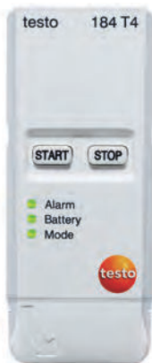
testo 184 T4