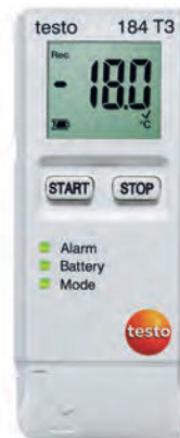
testo 184 T3