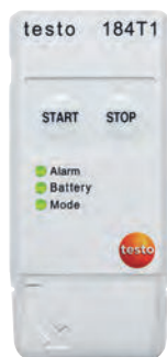
testo 184 T1

Обзор линейки логгеров данных testo 184.