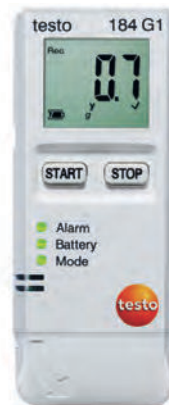
testo 184 G1