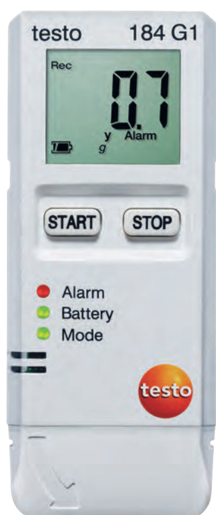
Реальный размер прибора

Все преимущества логгеров данных testo 184 с первого взгляда.