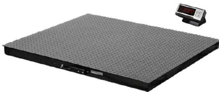
Рисунок 6 - Общий вид весов с терминалом, соединенным с ГПУ радиоканалом