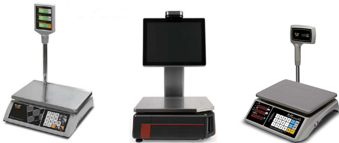
Рисунок 2 - Общий вид весов с терминалом, установленным на корпусе и на стойке, закрепленной на корпусе весов