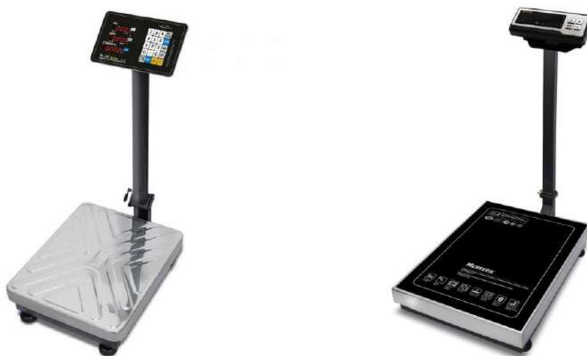
Рисунок 4 - Общий вид весов с терминалом, установленным на стойке, закрепленной на корпусе весов