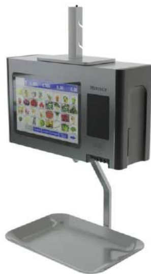
Рисунок 3 - Общий вид весов с ГПУ, расположенным под корпусом весов