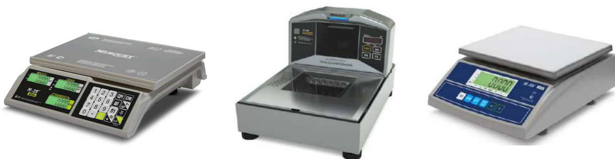
Рисунок 1 — Общий вид весов с терминалом, смонтированных в корпусе

Общий вид конструктивных исполнений весов показан на рисунке 1, 2, 3, 4, 5, 6, схема пломбировки от несанкционированного доступа и обозначение места нанесения знака поверки на рисунке 7.