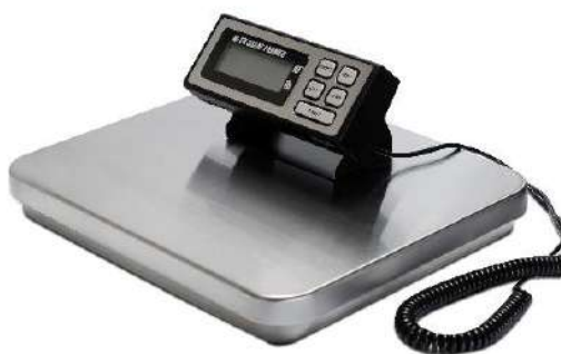
Рисунок 5 - Общий вид весов с терминалом, соединенном с ГПУ гибким кабелем