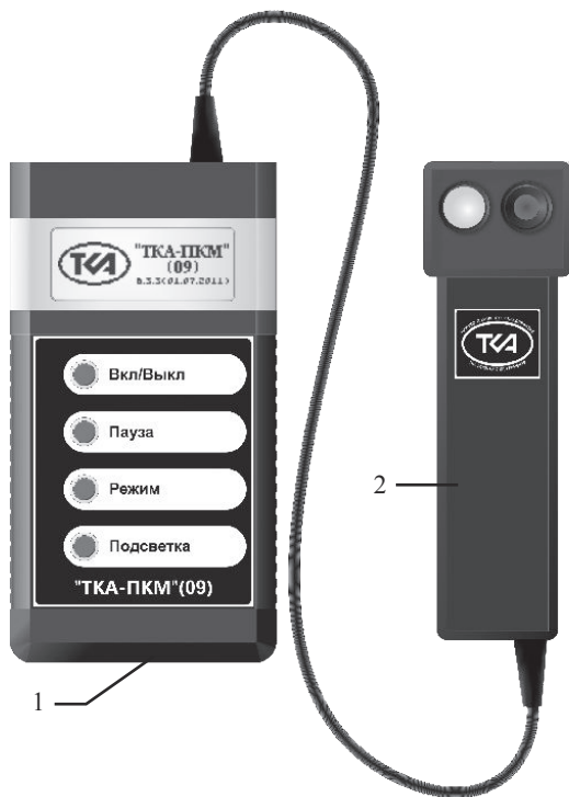
Рис.1. Внешний вид прибора “TKA-ПКМ”(09)