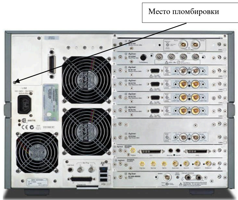
Рисунок 1 - Общий вид анализатора. Вид сзади