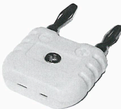
Рисунок 2 – Адаптер TC-to-banana